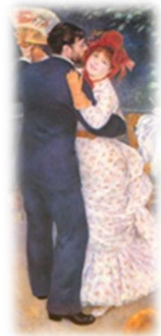
Bal à Bougival, Auguste Renoir