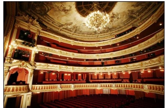
L'Opéra de Strasbourg